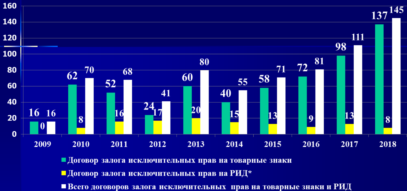
Рисунок 1 - Динамика зарегистрированных Роспатентом договоров залога товарных знаков и РИД за период 2009 – 2018 годы

(составлено автором на основе официальных отчетов Роспатента за 2009 - 2018 годы).