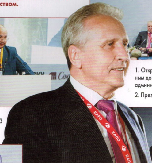
2. Президиум конференции.