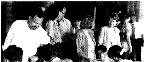
Идет регистрация участников семинара

Сегодня можно отметить, что прогнозы, которые делались при подготовке