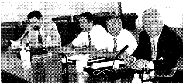
В президиуме – руководители ЕАПО и Евразийского патентного ведомства

Для сравнения. По данным Европейского патентного ведомства, относящимся к 1994 г., когда участников ЕПК было 17, в среднем в выданных европейских патентах указывалось 7,6 договаривающихся государств, или 45%.