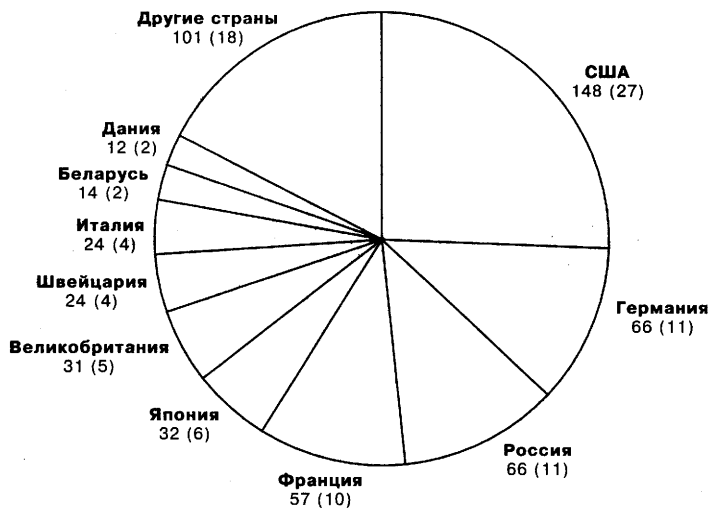
Рис. 2. Распределение евразийских заявок, поданных в ЕАПВ в 1996 – 1997 гг., по странам заявителей, шт. (%)